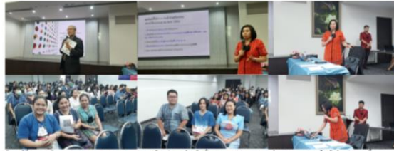
วันศุกร์ที่ 13 พฤศจิกายน 2563 เวลา 14.00 - 15.00 น. ณ ห้องประชุมสุโขทัย ชั้น 5 อาคาร 31 เทศบาลนครหน่วยตรวจสอบภายในเข้าร่วมประชุม "ชี้แจงแนวทางในการดำเนินงานจัดการความรู้ ประจำปีงบประมาณ พ.ศ. 2564"

ผู้ดูแลเว็บ admin 13 พ.ย. 63 - 31 ธ.ค. 66